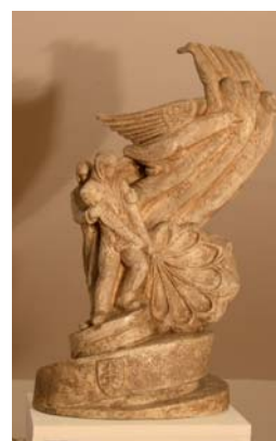
MAJERSKÝ Ladislav: Vojak s padákom 1942, sadra, 66x39x13