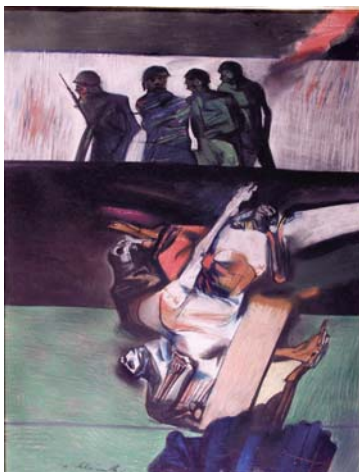
HLOŽNÍK Vincent: Oheň 1972, pastel, papier, 89x65