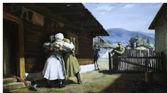
ČEMICKÝ Ladislav: Návrat nezvestného 1950, olej, plátno, 95x144