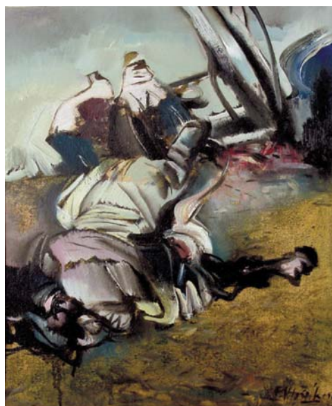
HLOŽNÍK Ferdinand: V boji 1956, tempera, papier, 47x35