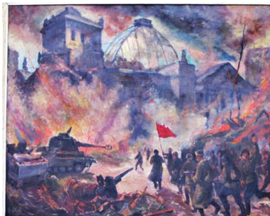
NEZNÁMY AUTOR: Boj o Reichstag 1958, olej, plátno, 100x152