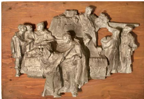
ZDRŮBECKÝ Vendelín: 9. máj 1979, laminát, 66x95x18, drevo, 82x111x2