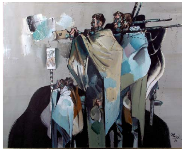
HLOŽNÍK Ferdinand: Na hraniciach 1975, tempera, papier, 65x89