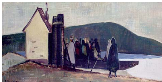
HLOŽNÍK Ferdinand: Partizáni na Váhu 1958, tempera, papier, 26x66