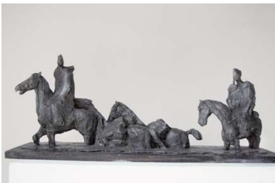
LUKÁČ Milan: Prechod cez Hron 1988, cín, 27x68x19, drevo, 21x71x1