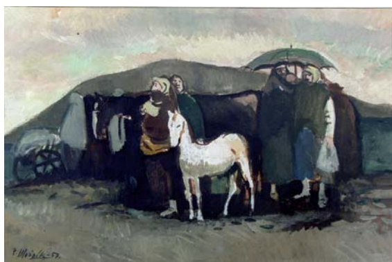
HLOŽNÍK Ferdinand: Utečenci 1957, gvaš, papier, 34x45