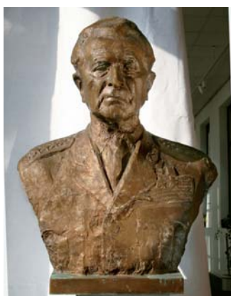
HLADÍK Karol: gen. Ludvík Svoboda 1967, bronz, 74x59x37