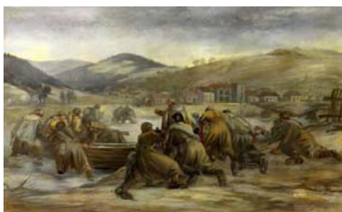
HLOŽNÍK Ferdinand: Útok Červenej armády cez Hron , 1955, olej, plátno, 139x220